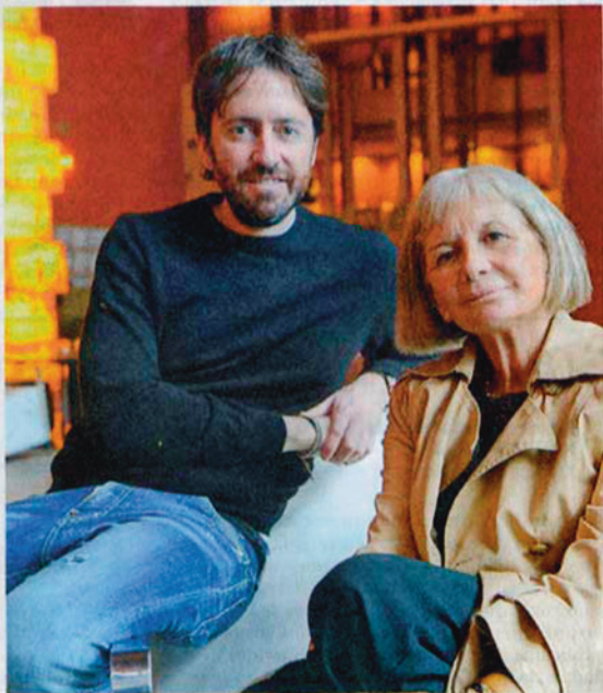
Los Premios Planeta Daniel Sánchez Arévalo y Alicia Giménez Bartlett